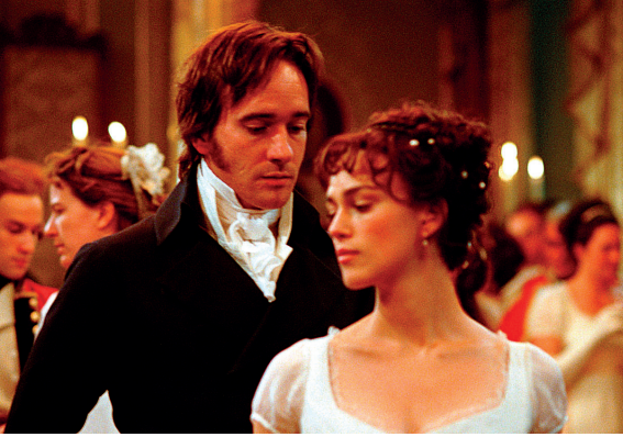
Matthew Macfadyen ve Keira Knightley "Gurur ve Önyargı"da başrollerde.