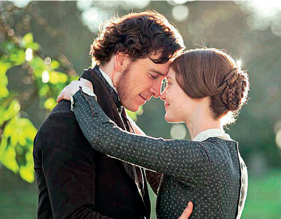
Michael Fassbender ve Mia Wasikowska "Jane Eyre"de başrolleri paylaşıyor.

Edgar ile evlenir. Ekonomik güvence uğruna aşkıdan vazgeçen kadın çok yaşamaz. Hayaleti de sırf aşkı kazanabilmek için zenginleşmiş Heathcliff'i ömür boyu kovalar. Fakat roman, bizi ağlatan bu imkânsız aşkla değil, Catherine'in kızının kendine denk kuzeniyle evlenmesiyle biter.