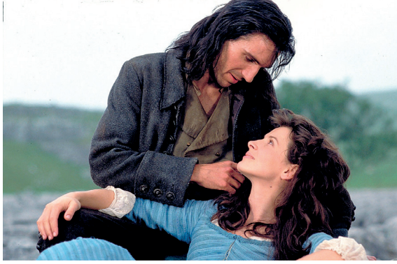
Ralph Fiennes ve Juliette Binoche "Uğultulu Tepeler" filminde.

İngiliz milliyetçiliğini koruyacak bir aşk hikâyesi yazan ablası Charlotte Bronte'nin aksine Emily Bronte, "Uğultulu Tepeler"de (1847) tek ırklı ve tek kültürlü İngiltere sanrısını kırar. Kuzey İngiltere'nin ıssız, sisli, rüzgârlı tepelerinde oynayan Catherine ve babasının evlat edindiği öksüz Heathcliff zamanla bir olur. Üvey kardeşlerin aykırı ruhları o kadar yakındır ki Catherine âdeta bütünleştiklerini hisseder: "Onu seviyorum çünkü o benim, benden öte bir parçam. İkimizin nasıl bir ruhu var bilmiyorum ama onunkiyle benimki birbirinin aynı." Ne kadar ruhları bir olsa da statü ve etnik kimlikleri farklıdır. Aile geçmişi bilinmeyen kıvrıkcık siyah saçlı Heathcliff, 'şeytani', 'tehlikeli', 'yabani' ve 'kontROLSÜZ' addedilir. Çingeneye benzeyen 'pis' bir çocuğa yemek yapmayı gururuna yediremeyen hizmetçi, hıncını sevenleri ayırarak alır. Heathcliff ile evlenirse bir dilenciye dönüşeceğine inandırılan Catherine; varlıklı, saygın, inançlı bir ailenin oğlu olan sarışın